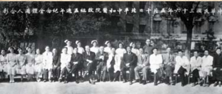
1947年纪念医院改组五周年合影