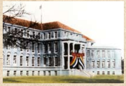
落成的北京中央医院主楼