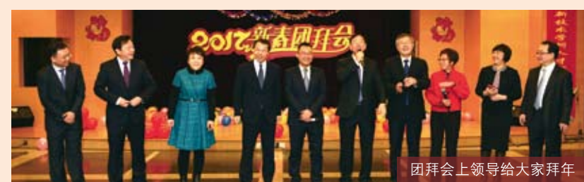
团拜会上领导给大家拜年