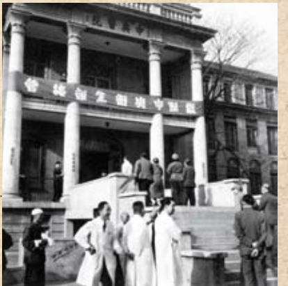
1950年4月中央人民政府卫生部接管医院