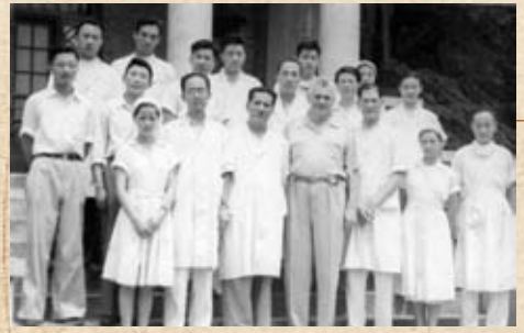
苏联专家与医护人员合影